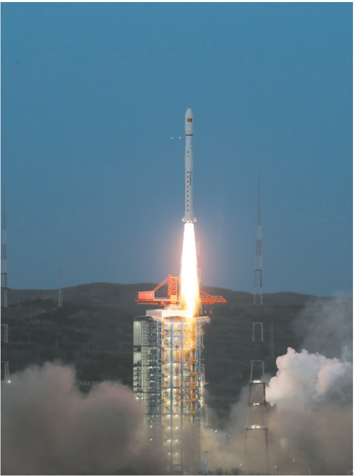
3月10日6时41分,我国在太原卫星发射中心使用长征四号丙运载火箭,成功将天绘六号 A/B 星发射升空,卫星顺利进入预定轨道,发射任务获得圆满成功。

据新华社乌鲁木齐3月10日电(记者顾煜)记者10日从中国石油塔里木油田获悉,位于新疆塔里木盆地富满油田的果勒3C井于9日顺利完钻,以9396米井深刷新亚洲陆上最深油气水平井纪录。 果勒3C井地处人迹罕至的塔克拉玛干沙漠腹地,地下地质构造异常复杂,油藏埋深普遍超8000米,地质认识和储层识别极其困难,具有世界罕见的超深、超高温、超高压等特点。不同于传统直井垂直穿过油层,这口井采用水平井钻探,在钻至8000米左右深度后,需要控制钻头沿着平行于油层的方向钻进,在地下深处精准穿透油气储层。