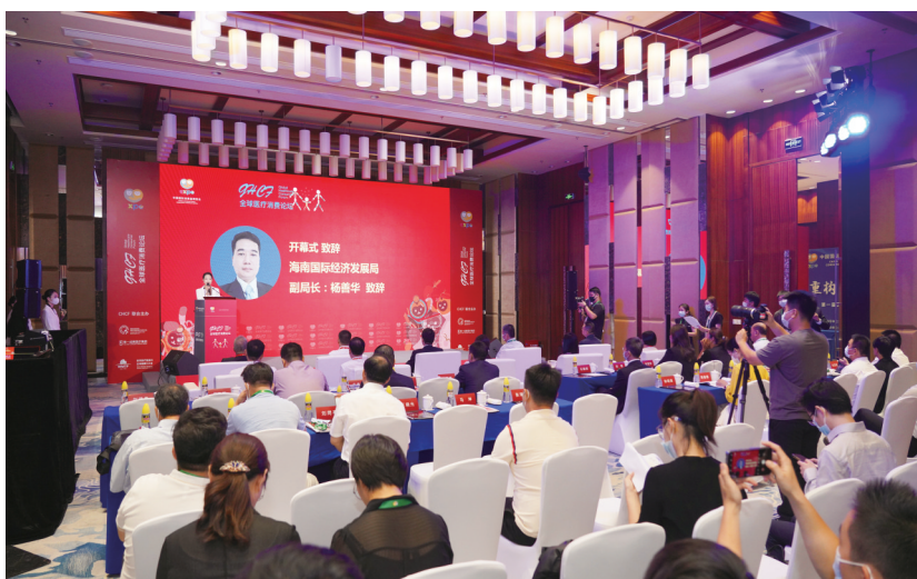
首届全球医疗消费论坛会场。

随着医疗健康消费市场蓬勃发展,主动寻求合作契机的企业越来越多。全球医疗消费论坛主办方海南第一成美医疗产业集团负责人表示,全球医疗消费论坛顺应时代发展及社会需求,立足海南、面向全国、放眼世界,通过整合资源、高效联动,以会为“媒”,为政府、企业、协会搭建国际性合作平台、缔结广阔的合作机会,促进