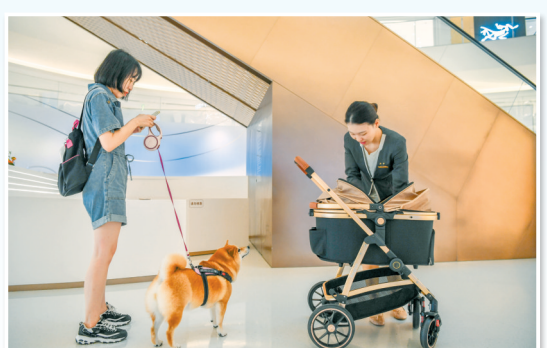
6月28日,在海口万象城商场,工作人员向市民提供宠物用车。

随着宠物成为人们越来越亲密的伙伴,携宠物出行逐渐成为“爱宠一族”的刚需。在此背景下,海口万象城、新城吾悦广场、远大购物中心、观澜湖新城等海口多家商城陆续加入“宠物友好商场”阵营,积极打造“人宠”友好空间,在有效吸引客流的同时,也彰显着海口有趣、有爱的城市包容度。