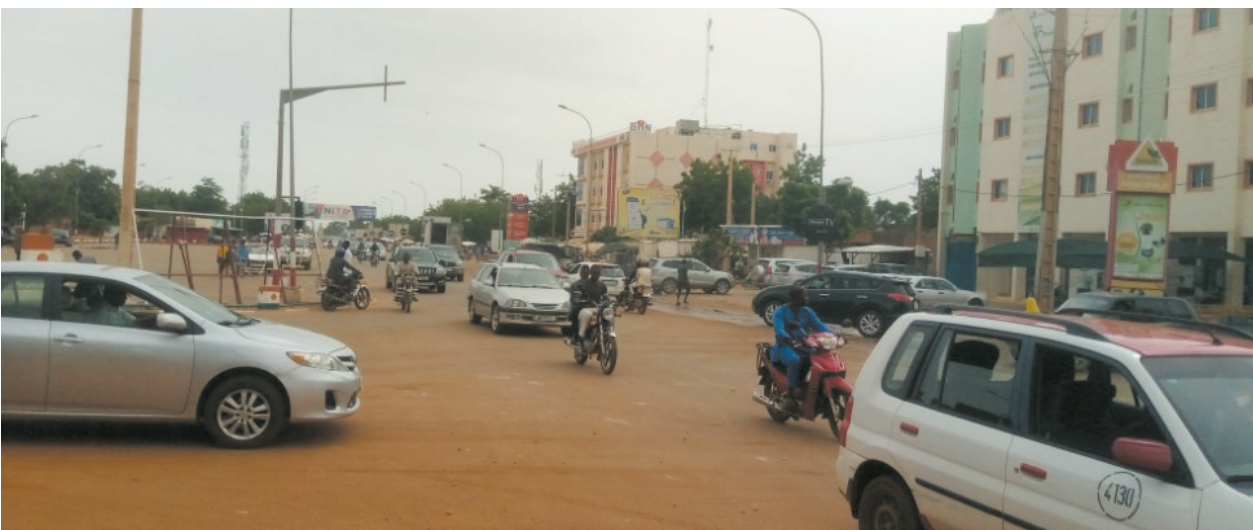
这是7月28日的尼日尔首都尼亚美街景。

成员国一名高级指挥官为消息源报道,西共体有意参与军事干预的国家还需要更多时间做准备。“在参加这类军事行动之前,我们需要集结部队。”