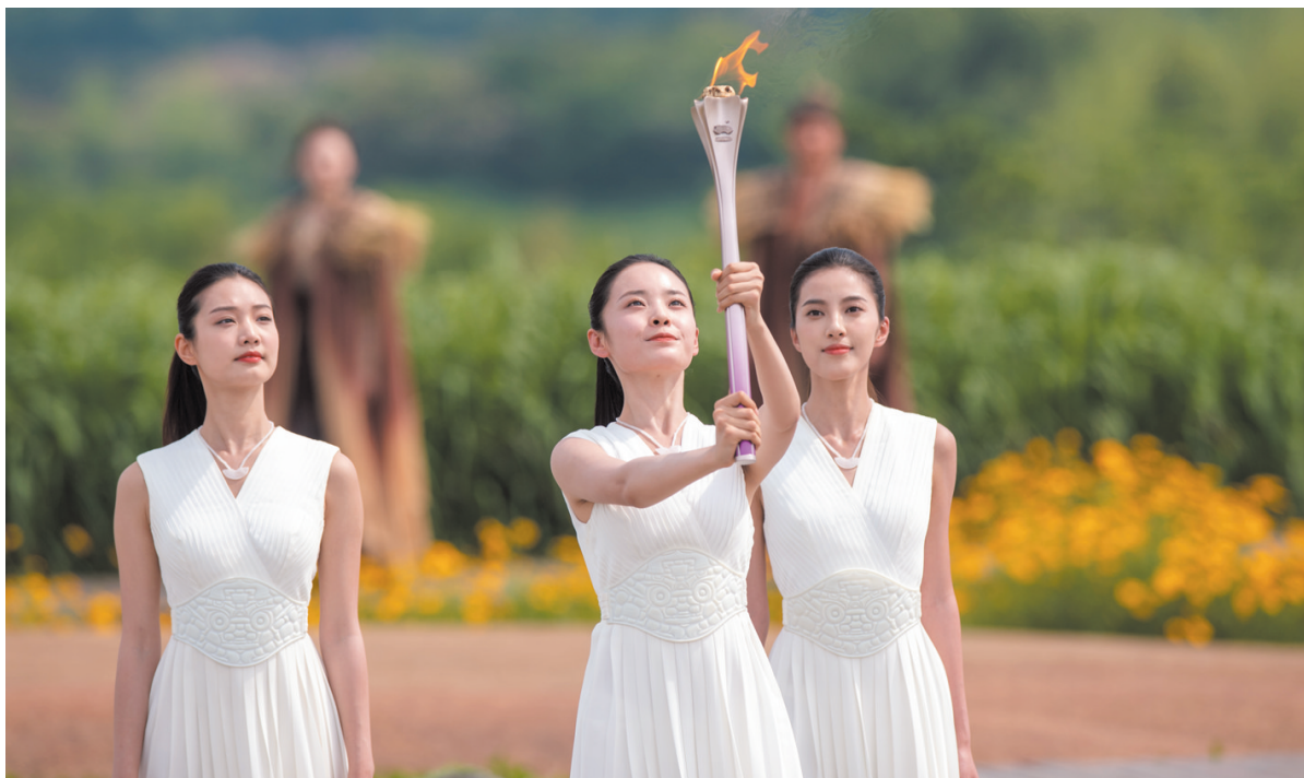
采火使者在杭州亚运会火种采集仪式上展示圣火(2023年6月15日摄)。

从北京到广州再到杭州，跨越33年光阴，中国将第三次以亚运会为名，为不同地域、不同肤色的人们搭建起和平与友谊的平台。在西子湖边、钱塘江畔、大运河旁，杭州期待和来自五湖四海的宾朋携手共奏“爱达未来”的和谐乐章。