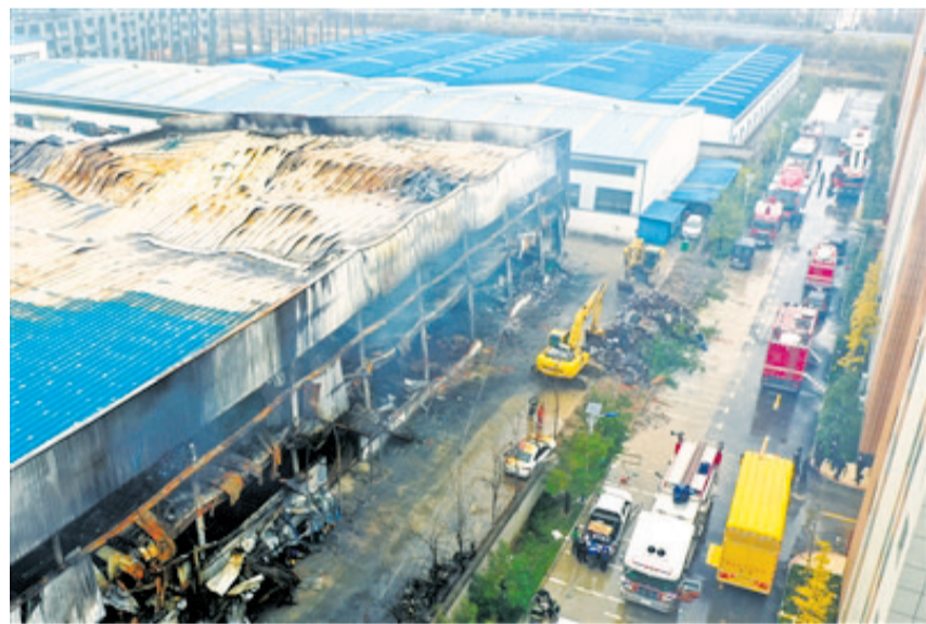
2022年11月22日,消防救援人员在河南安阳火灾现场。

同时,河南省对事故中存在失职失责问题的安阳市、文峰区、宝莲寺镇党委政府和消防救援、公安、应急管理、商务、自然资源、住房和城乡建设和管理等部门55名公职人员进行了严肃问责。其中,给予安阳市委书记袁家健党内警告处分,给予安阳市委副书记、市长高永