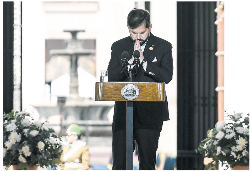
9月11日,在智利首都圣地亚哥,智利总统博里奇出席悼念活动。今年9月11日是智利阿连德政府遭军事政变推翻50周年纪念日。当天,智利首都圣地亚哥举行活动悼念政变受害者,智利、墨西哥等5国总统和多国前领导人参加。新华社发

1915年,海地发生动乱,美国以“保护侨民”为由出兵海地,对该国实施全面控制,直至1934年才撤军。20世纪50年代初,危地马拉政府推行土地改革,将美资联合果品公司的闲置土地分给无地农民。