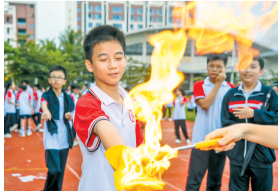
▼学生正体验“掌上火焰”项目。