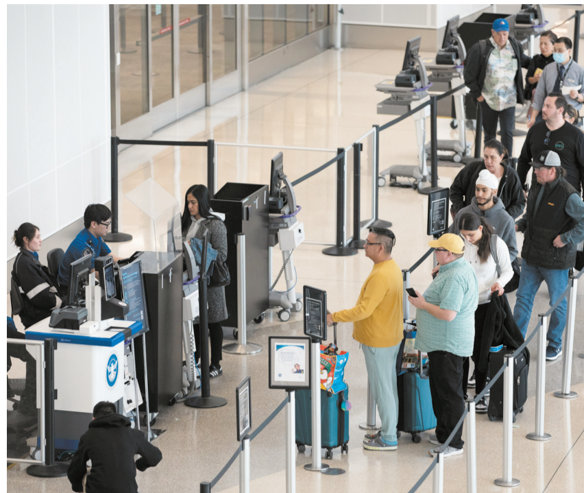
11月26日，旅客在美国加州旧金山国际机场准备出行。 据美国运输安全管理局预计，11月26日在美国机场接受安检的人数或将达到290万，创单日航空客流量新高。