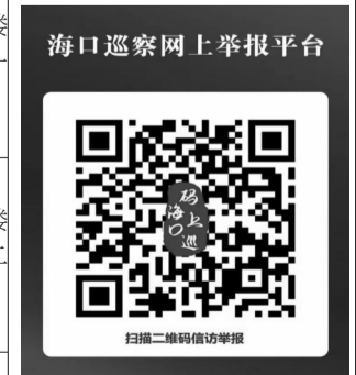
海口巡察网上举报平台