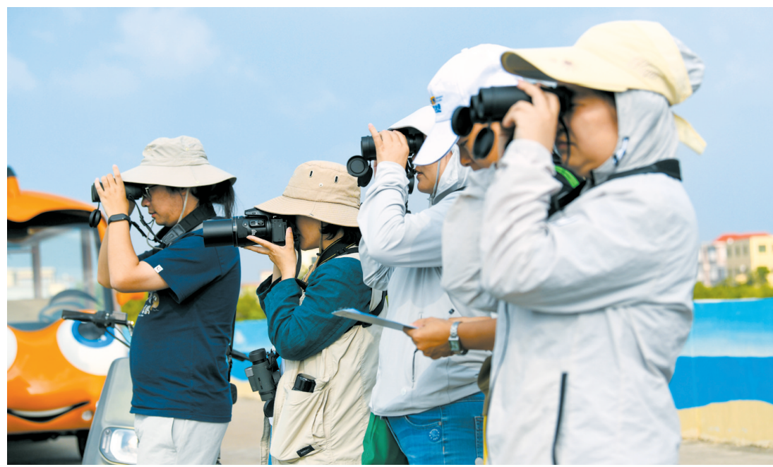
近日,在美兰区北港岛,大家举着望远镜观鸟。

本报12月5日讯(记者陈廷婷)近日,美兰区演丰镇北港村委会联合海南智渔可持续发展研究中心、炫蚂小队在北港岛开展生态研学活动。“亲子观鸟团”深入岛上各个角落,追寻各种鸟类的身影,在寓教于乐的氛围中学习鸟类知识,体验大自然的奇妙与生物的多样性。