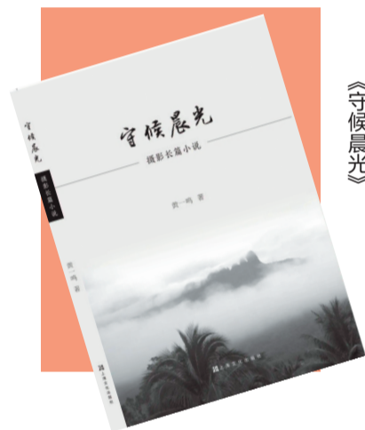
出版社:上海文化出版社 作者:黄一鸣

小说是一种非常自由、包容性极强的文体,小说该怎么写,从来没有边界的限定。文学可以有超越性的审美探索,时代和社会有足够的包容空间,但文学作品与普通读者之间的关系应该是融洽的,这是文学现场的主流。摄影长篇小说《守候晨光》放在的海南文学创作中,其探索意义和价值取向是不言而喻的,难在难能可贵。