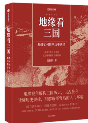
出版社:中信出版集团 作者:温骏轩

《流年》由《再婚记》《寻亲记》《成婚记》《求医记》《亲缘记》五个中短篇小说组成,它们既能互相独立阅读,又在人物、情节都相互串联,合成一部有关李老汉祖孙三代的长篇。故事发生在高密乡起凤镇,从上世纪50年代末讲起,横跨60年的光阴,展现岁月流年与时代江河奔腾中的细节往事。我们在书里能看到底层人物类般的生存意志,他们忍受着命运无情的反复拨弄,还始终在追寻和眷恋着这个世界曾给过的糖。