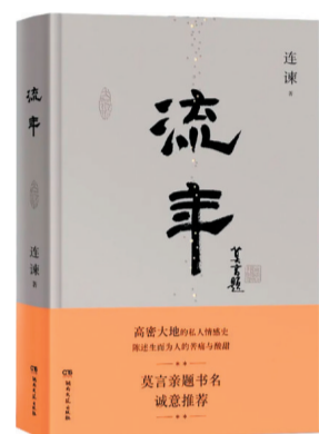
出版社:湖南文艺出版社 作者:连康

季美林是我国著名的学者和散文作家,本书收录了他游历国内著名景点时所写的游记,包括《登黄山记》《富春江上》《观秦兵马俑》《游小三峡》等等,记录他游览时的所见、所闻、所思、所感,表达了对祖国山川之美、文化之美、人情之美的欣赏和赞扬。作品集观景、咏物、叙事、怀旧为一体,既具有史料价值,也具有美学价值。阅读此书可领略季美林作为一代大师的奇思妙想和生花妙笔,亦可见学者散文内容的广博和思想的深厚。