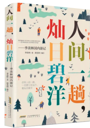
出版社:安徽文艺出版社 作者:胡光利