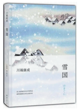
《雪国》 作者:川端康成 出版社:南海出版公司

“穿过县界长长的隧道,便是雪国。夜空下一片白茫茫……”一直很喜欢《雪国》的开白,古典唯美静寂,也许生命就像一场旅行,我们不知从何而来,又奔赴何处。漫漫旅程,总有些奇妙的邂逅,陪着你走过人生的一段旅程,回首,也是茫茫尘世一份温暖的慰藉。