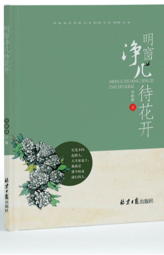
《明窗净几待花开》 作者:刘新昌 出版社:北京日报出版社

在阅读本书的过程中,我发现文中多次用到“晨光熹微”这个词,熹微这道光,微弱,朦胧、温和、绵柔、清醒……从模糊世界的逐渐消退,到朦胧爱意逐渐清晰延伸,不耀眼不张扬,却托起和放射出一个光亮的世界和新崭的未来……这是生命亮色和生命温暖的持久叩问,经久不息、辽阔而恒远的回响。