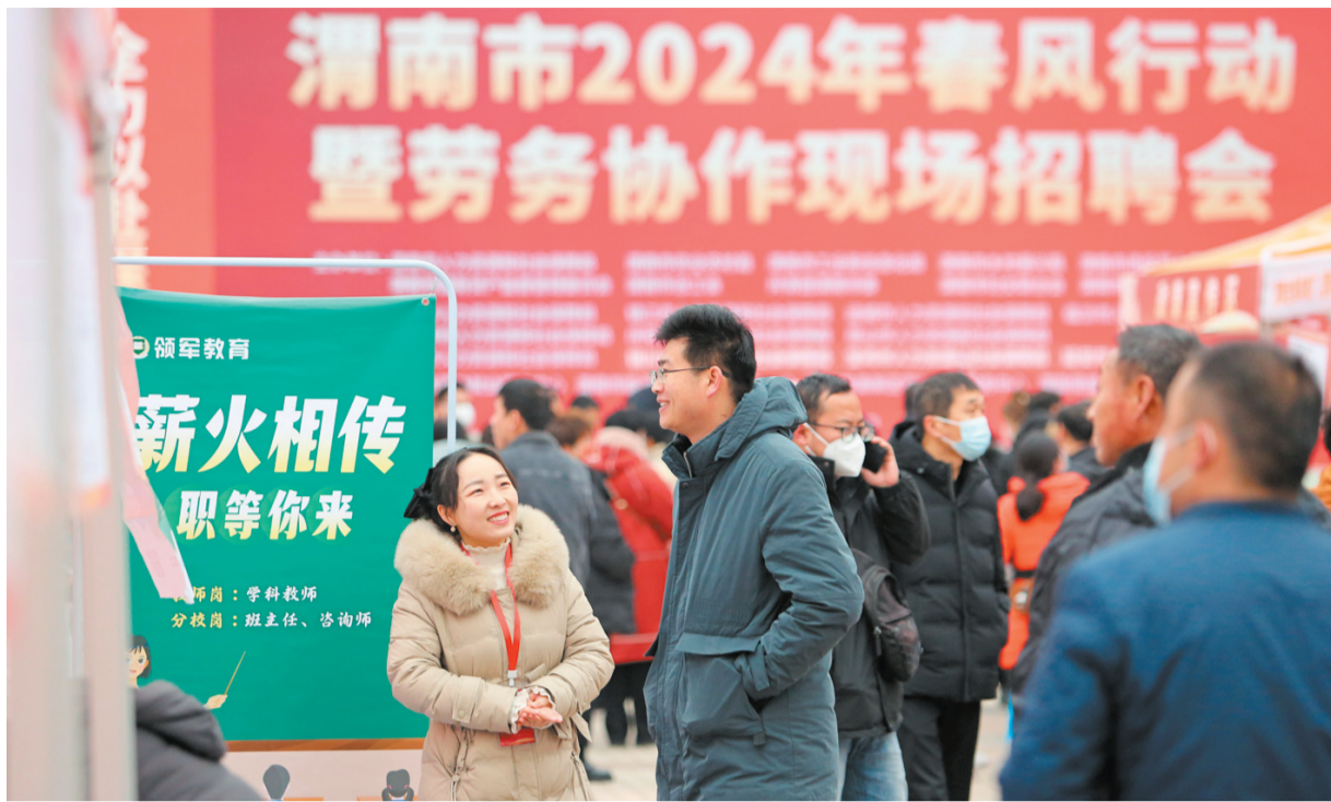
2月19日,求职者在陕西省渭南市2024年春风行动暨劳务协作现场招聘会了解企业招聘情况。