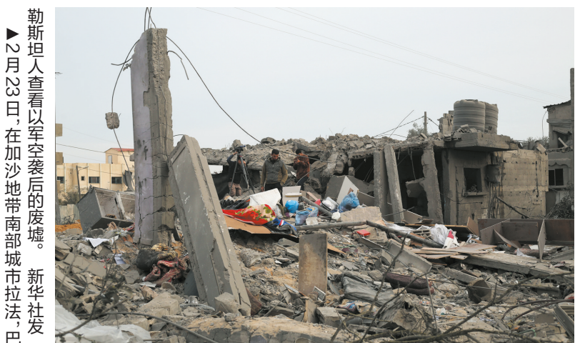
▲2月23日，在加沙地带南部城市拉法，巴勒斯坦人查看以军空袭后的废墟。新华社发

的多处住宅发动空袭，已造成至少50人死亡。目前仍有大量人员被埋在废墟下，无法得到救援。此外，以军23日凌晨继续轰炸加沙地带南部城市汗尤尼斯，目前已造成9人死亡。加沙地带南部城市拉法一处住宅23日遭以军袭击，至少6人死亡。