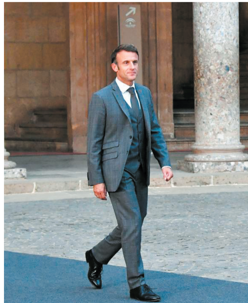
2023年10月5日,在西班牙格拉纳达,前来参加第三届欧洲政治共同体领导人会议的法国总统马克龙抵达阿尔罕布拉宫。

法国前总理多米尼克·德维尔潘在一档电视访谈节目中也曾批评马克龙“派兵论”起不到所谓“战略模糊”的威慑效果,只是自顾自的“战略激动”。德维尔潘指出,派兵援乌是个“危险游戏”,至少存在五大风险:刺