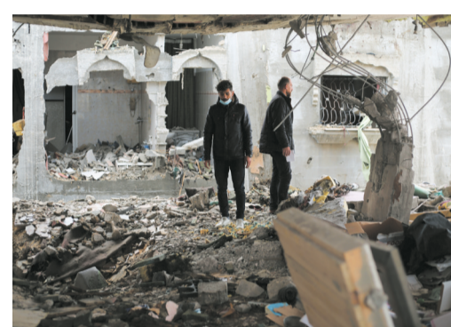
3月19日,在加沙地带南部城市拉法,人们查看以军轰炸后的建筑废墟。

据巴勒斯坦通讯社3月19日报道,以色列军队当天密集轰炸加沙地带北部和南部多个地区,造成至少38人死亡。