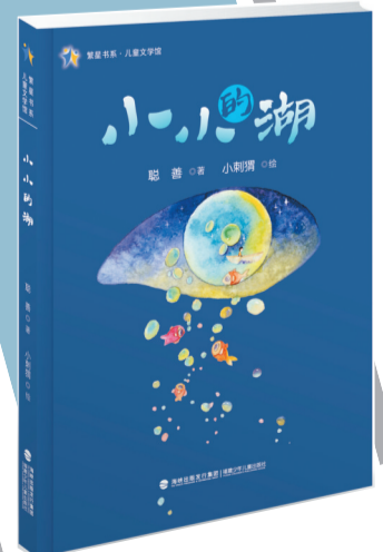
《小小的湖》 作者：聪善 出版社：福建少年儿童出版社

与此同时，诗人对雾、月光、叶子、小蜗牛、长颈鹿、小草、风儿、根与泥土等的富于想象色彩的拟人化描绘，将孩子的问题和他们探索世界的愿望联结在一起，带领者在儿童的目光和想象里穿行，觉得万物真的生命、有灵性，同样有喜有悲。如《小花》《听榆树爷爷讲故事》《风儿找家》等，完全是出于孩子对大自然的感受，那色彩、那声响、那动感，都是童年生命力特有的表现。从这些诗歌里，我们可以感受到聪善保留着完整的儿童的感觉。其间的每一首小诗，以孩子的眼睛去观察，以孩子的心灵去感受，以孩子的口吻娓娓道来，不造作，不堆砌。正是因为诗人全身心回归童年的感觉和状态，使得整本诗集始终透露出轻松、谐趣的气息，生活色调变化丰富，从而尽显质朴、自然天成