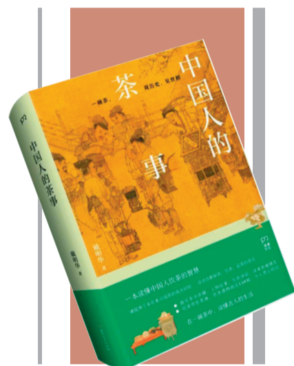
出版社：湖南人民出版社 作者：戴明华 《中国人的茶事》

一杯茶，或苦或甜，或浓或淡，牛饮可解燥，慢品能怡情。“喝茶不一定会令人长寿，书画也好，茶酒也罢，重要的是要过不纠结的人生。”虽然每个人对茶叶的选择各异，咖啡、奶茶也在当下年轻人群中异军突起，但是由茶叶浸泡出的这种清透飘香、微苦回甘的茶汤，却永远是典型的中式味道，是一种流淌在中国人的血液中、印刻在乡愁里的滋味。