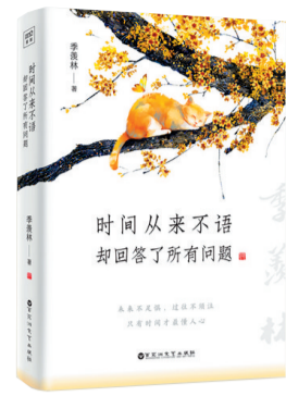
《时间从来不语，却回答了所有问题》 作者：季羡林 出版社：百花洲文艺出版社

《时间从来不语，却回答了所有问题》是作家季羡林的散文作品集，共收录了40篇具有代表性作品。我阅读这本书时，仿佛回到了小时候趴在爷爷膝上听故事的场景，感受到一个童趣的老人在讲一本叫做人生的故事。