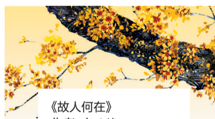
《故人何在》 作者：丰子恺 出版社：人民文学出版社

此情可待成追忆，只是当时已惘然。丰子恺用一颗追忆的心来怀念那些儿时旧识、亲人师友，叙说着他们琐碎生活中的艰辛、坚持和点点欢乐。他的笔下饱含思念、感恩和爱。在他的眼中，处处都存在着人性的美好，并成为