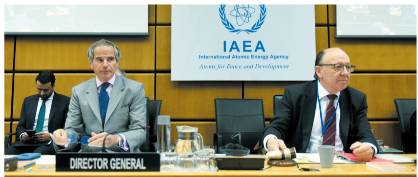
4月11日,在奥地利维也纳,国际原子能机构总干事格罗西(前左)出席国际原子能机构理事会特别会议。

国际原子能机构总干事格罗西11日在机构理事会特别会议上表示,由于近期针对扎波罗热核电站的一系列无人机袭击显著增加了其发生核事故的风险,他呼吁各方保持最大限度军事克制,充分遵守机构关于维护扎波罗热核电站安全的5项具体原则。