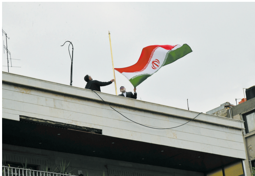
4月8日,在叙利亚首都大马士革,伊朗驻叙利亚使馆领事部门新址升起伊朗国旗。

伊朗的要求还包括,伊朗今后对以色列进行“有限打击”后,美方不得介入。上述消息人士说,美方拒绝接受这一条件,呼吁伊方保持克制,寻求外交解决,同时称,如果伊朗直接打击以色列,美方将向以方提供支持。