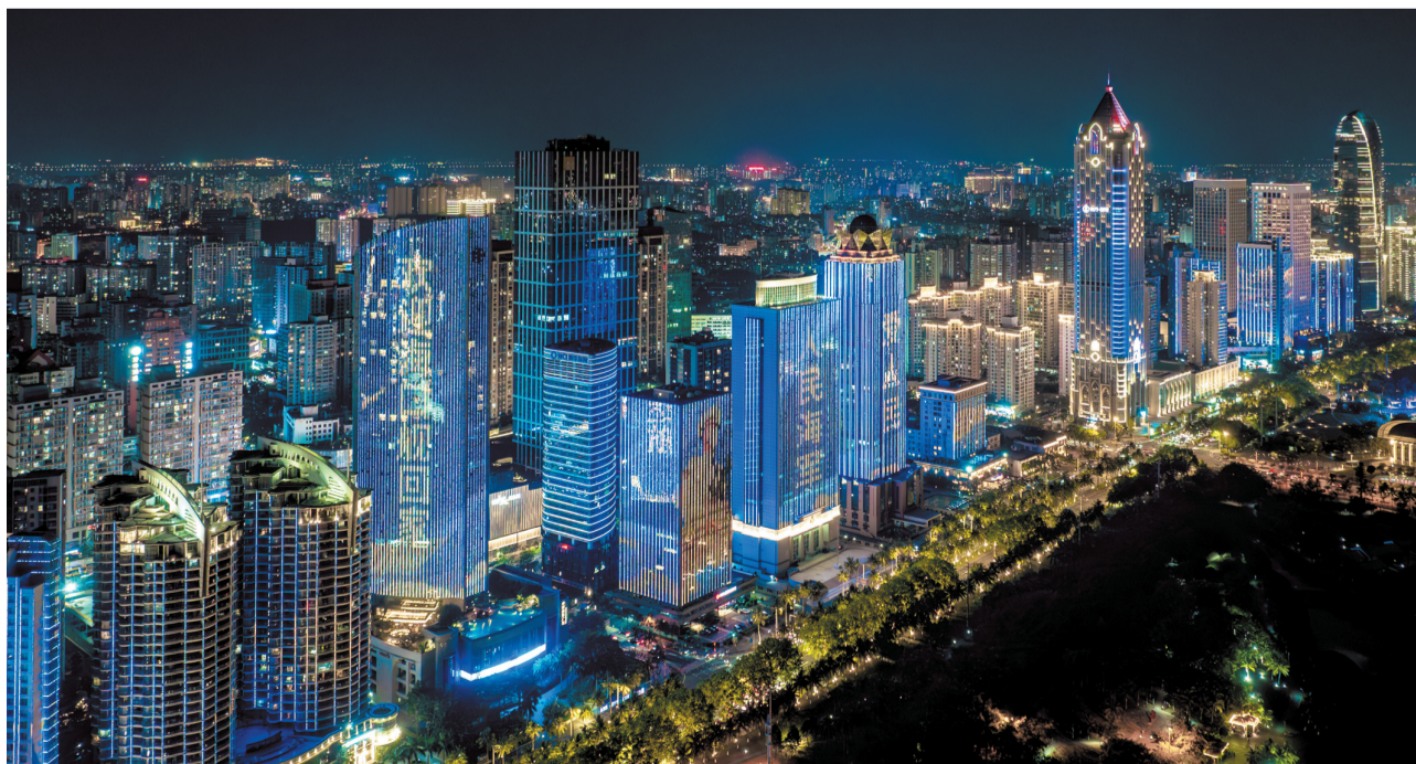
在人民海军成立75周年纪念日来临之际,4月20日晚,海口滨海大道楼宇亮起主题灯光秀,“欢迎海口舰回家”“人民海军爱人民”等字幕出现在璀璨的灯光中,照亮椰城夜空,盛情迎接海口舰“回家”。