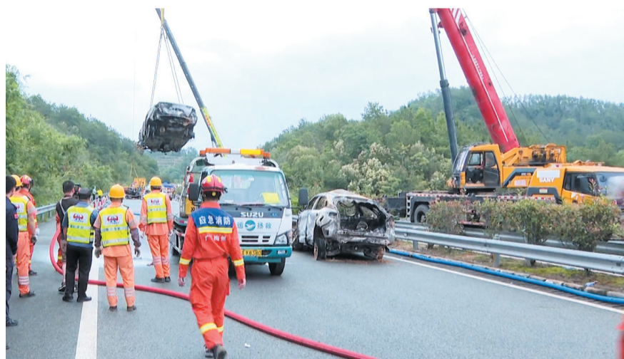
5月1日,救援力量在广东梅大高速路面塌方事故现场开展紧急救援。

消防救援局局长周天持续调度指导现场救援工作。塌方发生后,当地立即组织应急、消防、矿山救护队等500余人参与现场救援。目前,救援工作仍在进行中。应急管理部有关负责人表示,“五一”假期期间出行出游人员增多,交通运输、旅游景点、人员密集场所等安全风险较高,将进一步完善预案措施、排查风险隐患、加强安全防范。