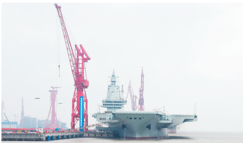
这是首航前靠泊在码头的福建舰(4月30日摄)。