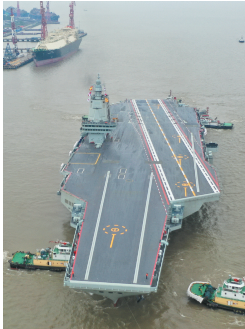
这是拖船正在将福建舰拖离码头(无人机照片)。