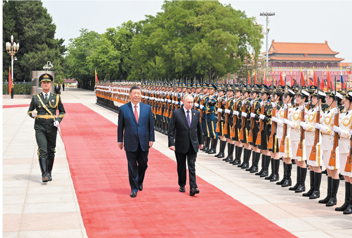
5月16日上午,国家主席习近平在北京人民大会堂同来华进行国事访问的俄罗斯总统普京举行会谈。这是会谈前,习近平在人民大会堂东门外广场为普京举行隆重欢迎仪式。

新华社北京5月16日电(记者杨依军 王宾)5月16日上午,国家主席习近平在北京人民大会堂同来华进行国事访问的俄罗斯总统普京举行会谈。