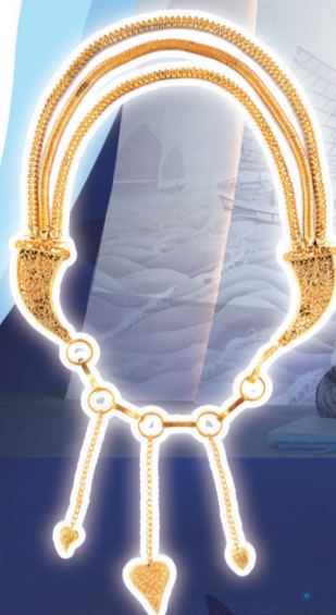
金三重顶犀角形牌饰项链 (“南海1号”出水)。