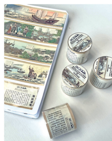
该文创产品以南宋时期海丝商贸活动为主

题,提炼出万里海道、海丝奇珍、船业发达、蕃商互市、海天情长、量天测海、怒海惊涛、深海潜龙等九个篇章情景,生动展现海丝商贸的全过程。