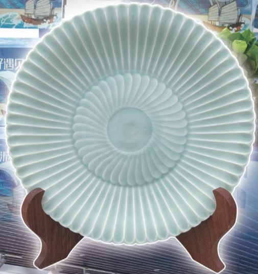
↑“千年遇见泥”生态盲盒——南海1号遗址泥考古盲盒。 —龙泉窑系列文创产品—— 龙泉窑青釉菊瓣纹盘。