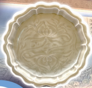
宋龙泉窑青釉刻划莲纹折腰 花口碟(“南海1号”出水)。