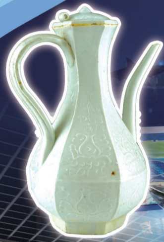
宋青白釉六棱执壶 (“南海1号”出水)。