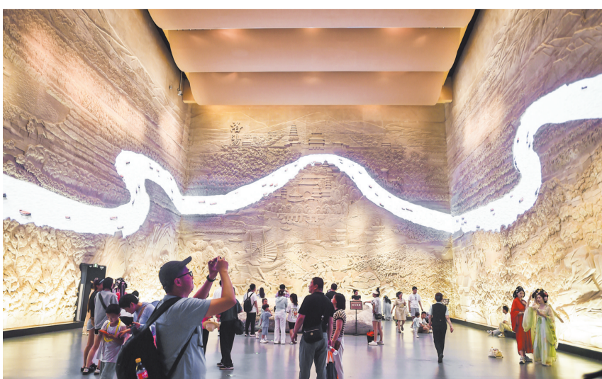
►5月18日，观众在河南省洛阳市隋唐大运河文化博物馆参观。

本次活动还配套举办主题论坛、青年论坛、策展人论坛和秦汉文明国际学术研讨会等。全国各地围绕国际博物馆日主题，开展数千场内容丰富、形式多样的活动。据悉，2025年“5·18国际博物馆日”中国主会场活动举办城市为北京。