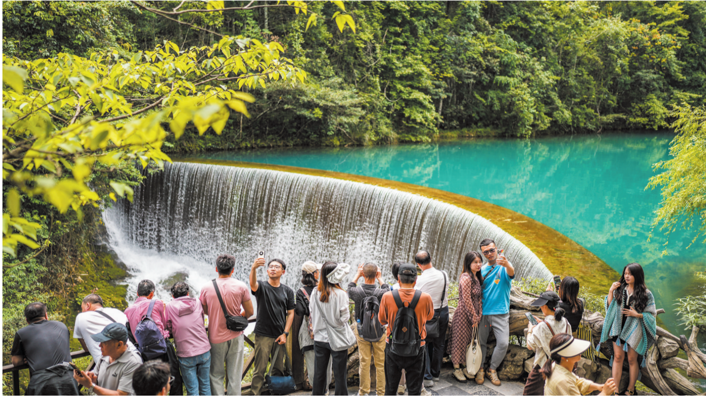
游客在荔波县小七孔景区观光游玩(5月16日摄)。

县域旅游走红背后，有天时、地利、人和多重因素；更值得思考的是，“火起来”的县城，该如何“火下去”？