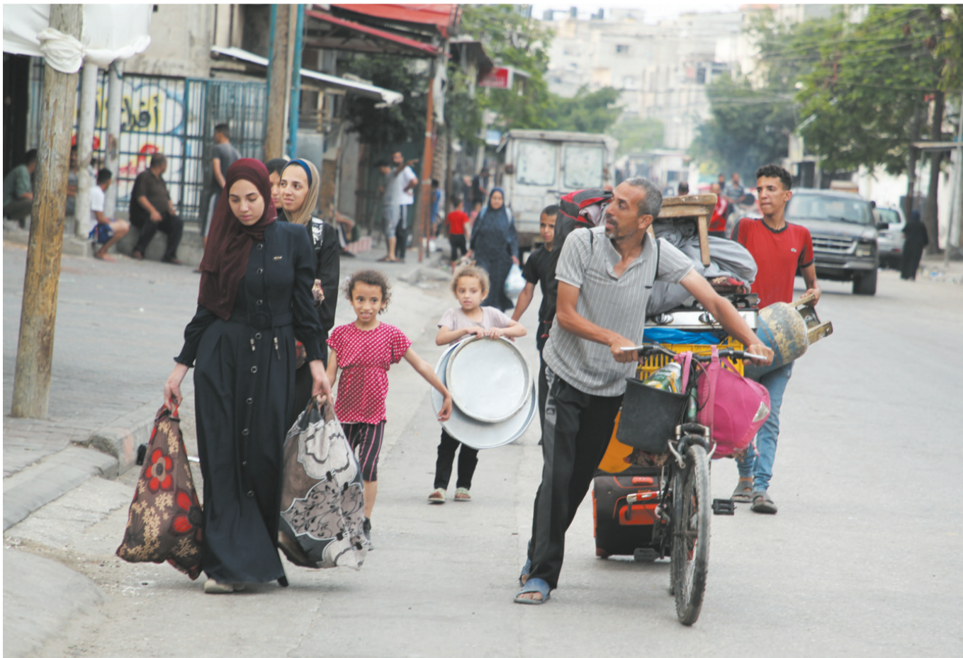
5月28日,在加沙地带南部城市拉法,人们逃离家园。

分析人士指出,“全球南方”国家在推动联合国等多边机制在巴勒斯坦问题上采取更公正立场起到了重要作用。它们认识到西方特别是美国主导的国际秩序存在诸多不公之处,正在以实际行动推动改变这一现状。