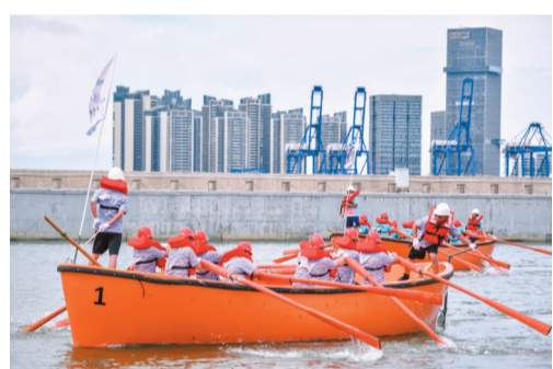
6月24日,在海南省第一届海员技能大比武现场,参赛选手进行水上操艇比赛。

本报6月24日讯(记者陈晓洁 通讯员张茜 石俊 吕东星 方旭霞摄影报道)6月25日是第14个“世界海员日”。记者从海南海事局获悉,6月24日,以“建功自贸港 奋进新征程”为主题的海南省第一届海员技能大比武在海口火热开赛,来自全省航海院校和航运公司的9支队伍90名选手同场竞技,比拼技能,展示风采。