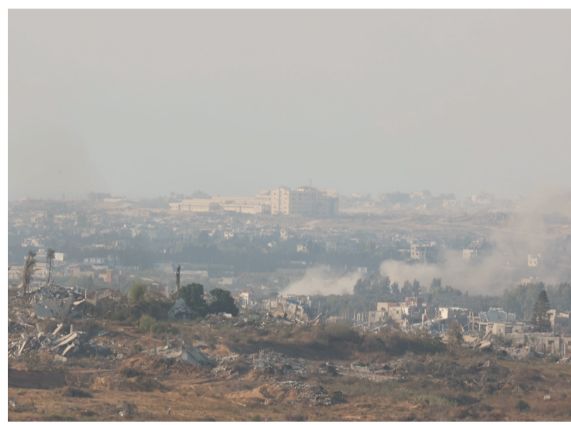
这是6月23日在以色列与加沙边境以方一侧拍摄的加沙地带遭破坏的景象。

同一天,以国防部长约亚夫·加兰特抵达美国华盛顿,将与美国国防部长劳埃德·奥斯汀、国务卿安东尼·布林肯等美方高级官员会晤,就加沙地