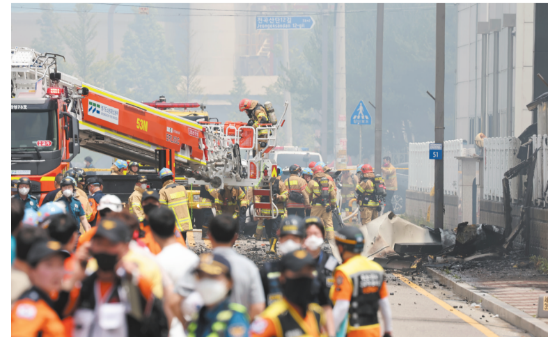
6月24日,消防队员在韩国京畿道华城市的一座电池工厂火灾现场工作。据韩联社24日消息,已确认20余人在韩国京畿道华城市电池工厂火灾中遇难。