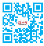
海口网 更多新闻资讯