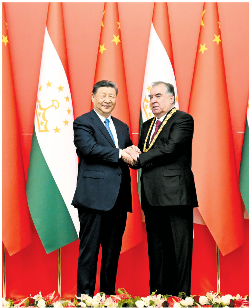
当地时间7月5日下午，国家主席习近平在杜尚别总统府举行隆重授勋仪式，向塔吉克斯坦总统拉赫蒙颁授“友谊勋章”。这是两国元首亲切握手。

新华社杜尚别7月5日电(记者郑开君 史霄萌)当地时间7月5日下午，国家主席习近平在杜尚别总统府举行隆重授勋仪式，向塔吉克斯坦总统拉赫蒙颁授“友谊勋章”。