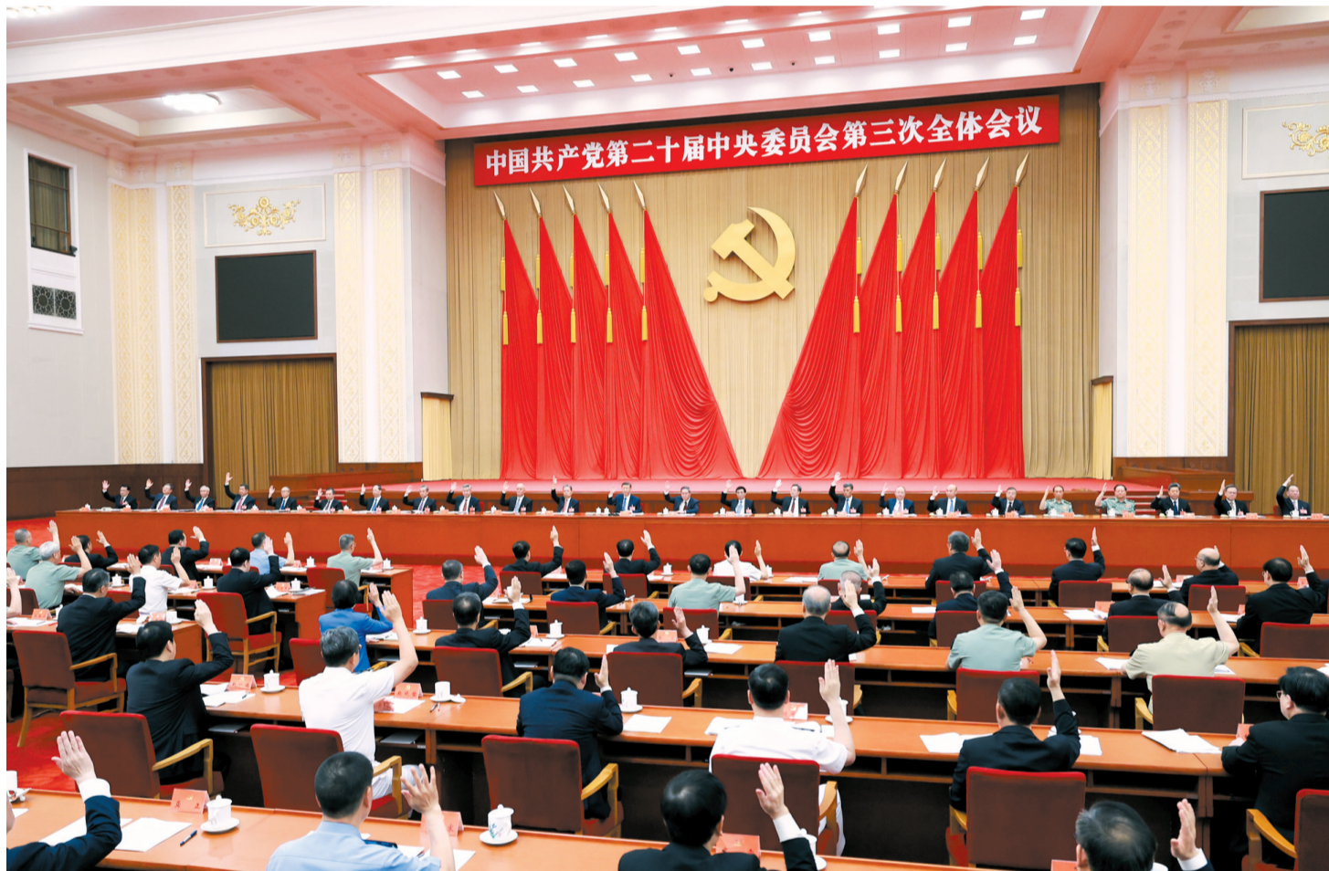
中国共产党第二十届中央委员会第三次全体会议,于2024年7月15日至18日在北京举行。中央政治局主持会议。新华社记者 王晔 摄