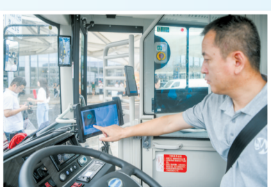
▲安全员在操控智能驾驶系统,进行车辆出发前的准备工作。