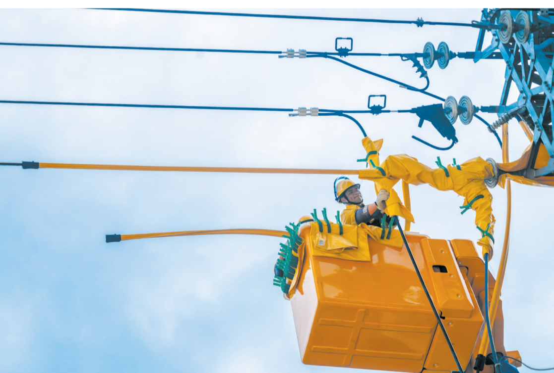
海南电网工作人员开展线路消缺带电作业,持续推进迎峰度夏工作有序开展。

和充电量,均达到全天的30%左右。”海南省充换电一张网服务公司政务服务专员马肖介绍,随着新能源汽车保有量的快速增长,其充电量也“步步高升”。据了解,今年以来,我省统调负荷已6次创历史新高,突破800万千瓦,其中5次发生在0:00—0:20时段,均与新能源汽车扎堆充电有关,充电负荷在不到20分钟内达50万千瓦以上,形成“零点高峰”现象。