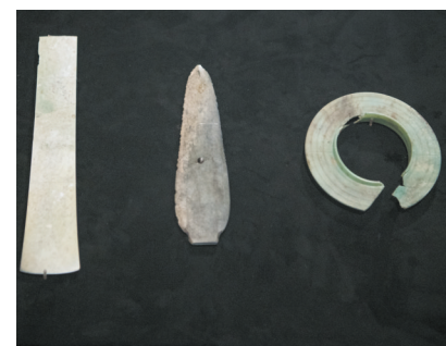
这是在四川省广汉市拍摄的三星堆遗址发掘区出土的玉器(2024年7月21日摄)。