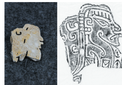
左图是2024年7月10日在四川省文物考古研究院拍摄的玉石上阳刻的侧身人像;右图是玉石上阳刻的侧身人像拓片。