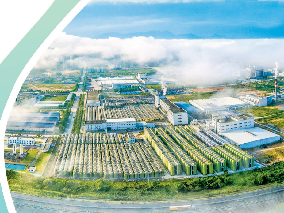
阳西县调味品产业基地。