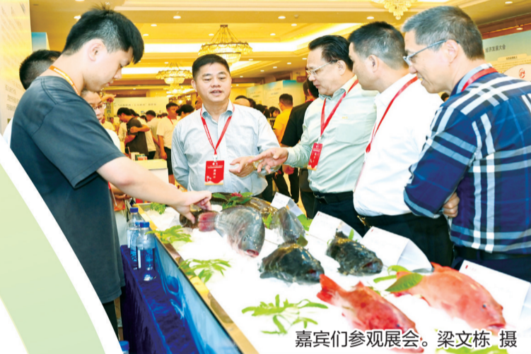
嘉宾们参观展会。梁文栋 摄