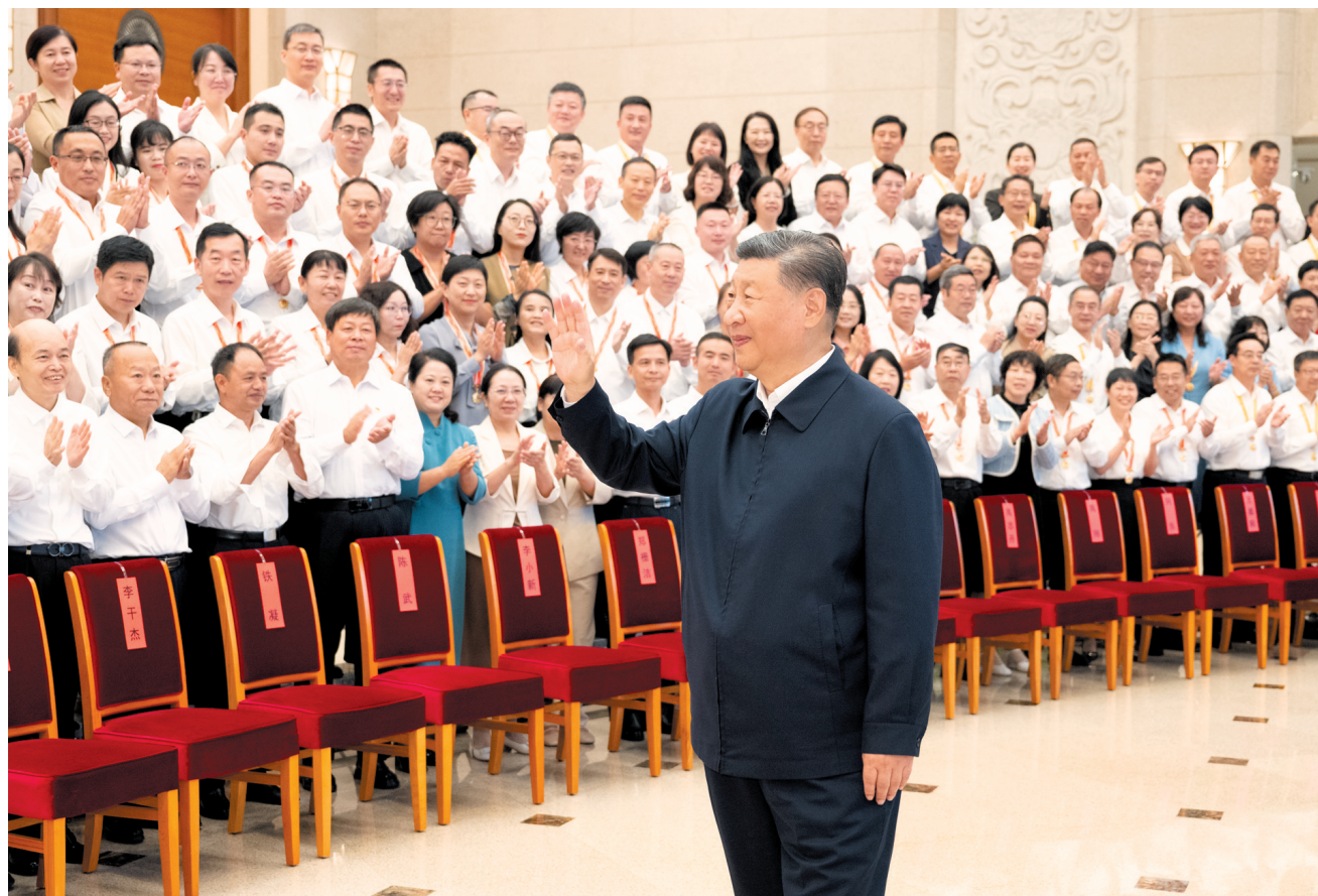
9月6日,党和国家领导人习近平、李强、蔡奇、丁薛祥等在北京接见参加庆祝第四十个教师节暨全国教育系统先进集体和先进个人表彰大会代表。

新华社北京9月10日电 全国教育大会9日至10日在北京召开。中共中央总书记、国家主席、中央军委主席习近平出席大会并发表重要讲话。他强调,建成教育强国是近代以来中华民族梦寐以求的美好愿望,是实现以中国式现代化全面推进强国建设、民族复兴伟业的先导任务、坚实基础、战略支撑,必须朝着既定目标扎实迈进。