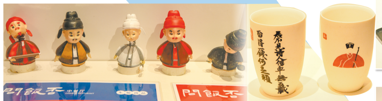
象设计之东坡 ▼潮玩形坡