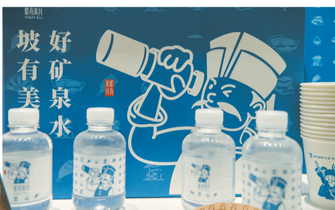
▲“坡有美井”矿泉水包装设计。

海南大学美术与设计学院相关负责人表示,文创产品设计实践的难点是挖掘深层次的特色元素,不但要结合东坡文化进行再设计,将文化精髓融入产品中,也要给消费者带来丰富的文化体验,让东坡文化得到更好的呈现,让东坡文化“活”起来。