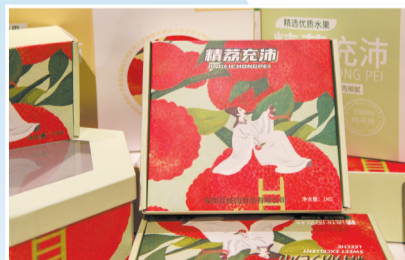
▲精“荔”充沛,荔枝包装设计。