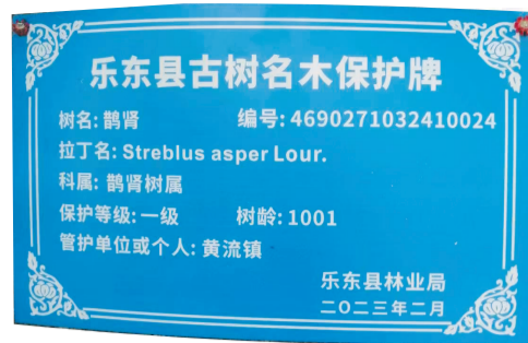
▲千年鹊肾树的保护牌。

故乡情,不辞辛劳,不计报酬,做真实的传承者和继承人,撰写一批家乡题材的历史文章,使得海南各市县的史料得到了进一步的丰富、积累、补正,是对家乡最好的回报。