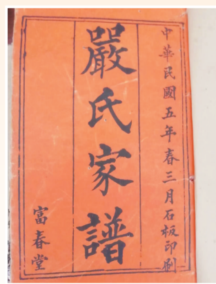
在文昌清澜发现的民国《严氏族谱》(孤本)。