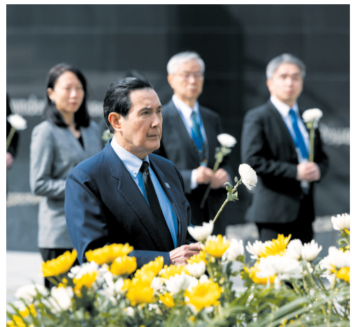
3月29日,中国国民党前主席马英九一行参观了侵华日军南京大屠杀遇难同胞纪念馆,深切悼念遇难同胞。