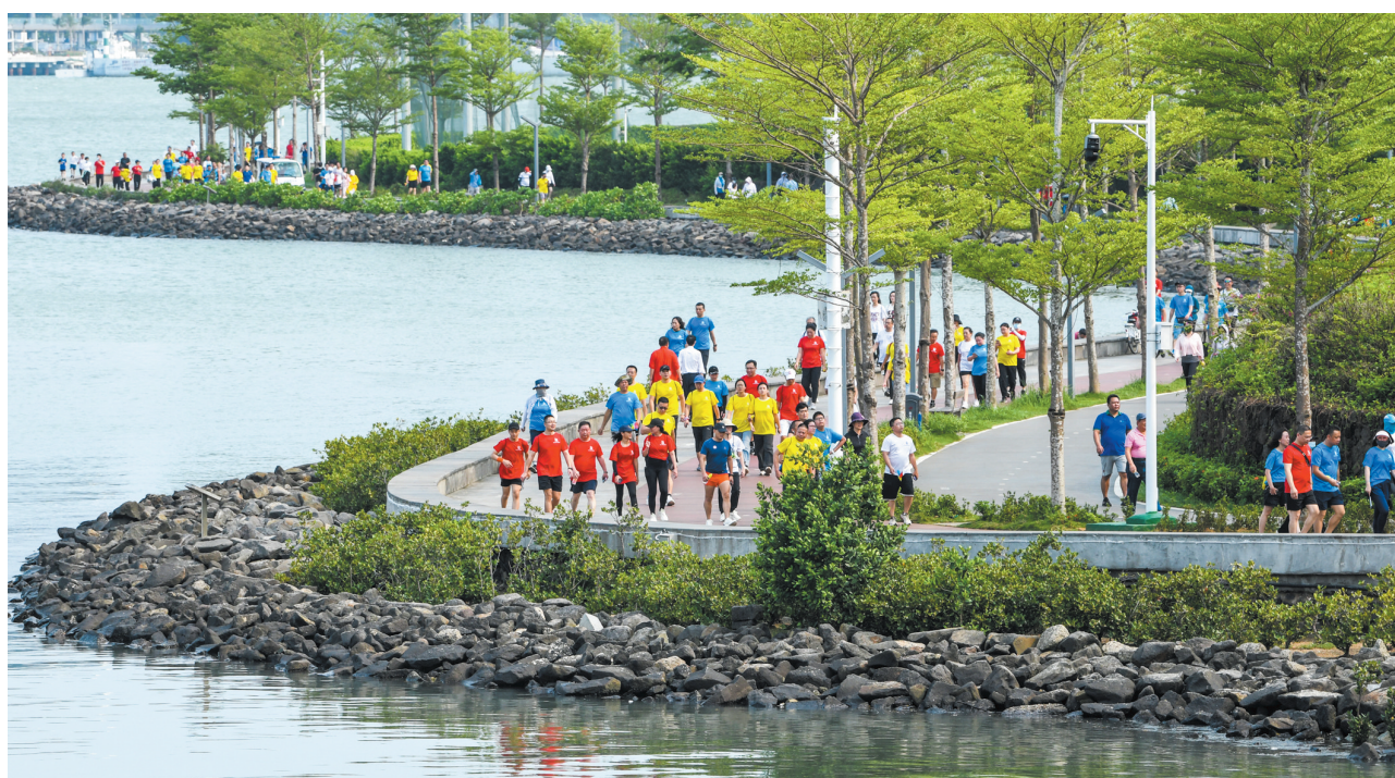
4月22日,2023海南万人健步大会在海口举办。这是参赛者边走边欣赏滨海美景。本报记者 康登淋 摄

本报4月22日讯(记者周慧 龙易强)4月22日,2023海南万人健步大会在海口万绿园开走。当天上午7时30分,伴随着响亮的鸣笛声,以“前路虽远·行则将至”为主题的2023海南万人健步大会拉开了序幕。一路风景一身爽,3个多小时后,参加此次健步活动的职工群众陆续完成10公里健走路程。