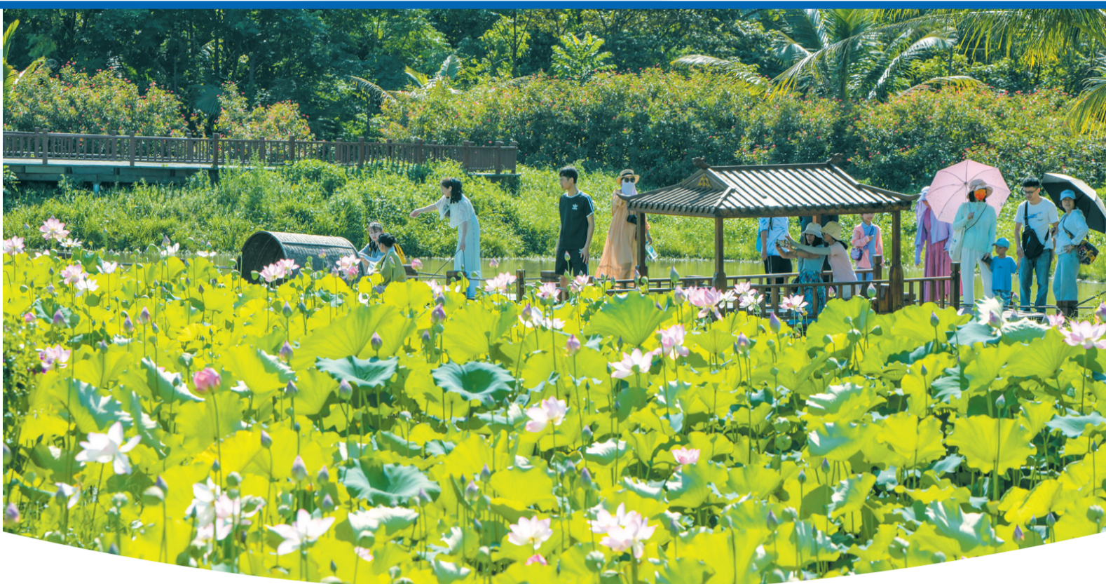
美兰区芳园国际艺术村荷花盛开,市民游客在栈道上赏荷。