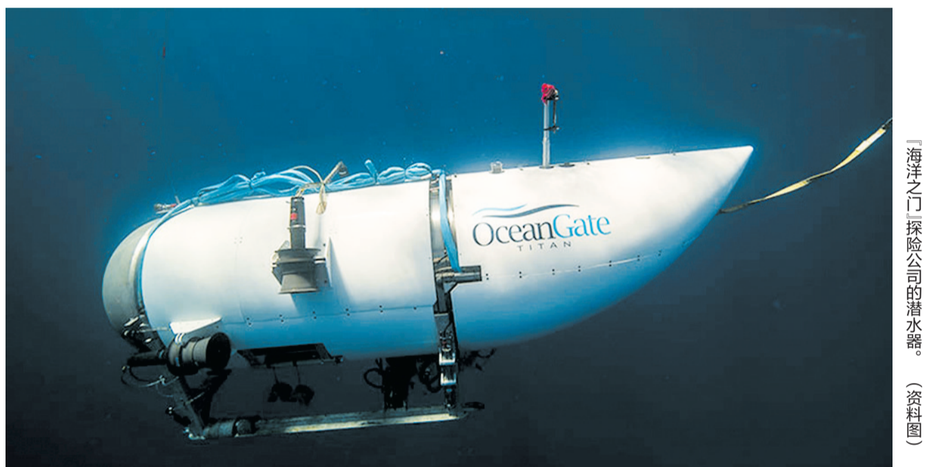
“海洋之门”探险公司的潜水器。(资料图)

美国海岸警卫队19日说,一艘搭载5人的美国深海潜水器18日下潜考察“泰坦尼克”号邮轮残骸时失踪,美国和加拿大海岸警卫队正在搜救。考察队日前乘船从加拿大东部出发,前往位于北大西洋的“泰坦尼克”号邮轮沉没水域,18日早上乘“泰坦”号深潜器下潜,但下潜约1小时45分钟后失联。