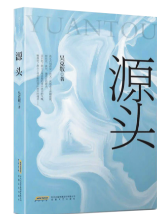
出版社:安徽文艺出版社 作者:吴克敬 《源头》