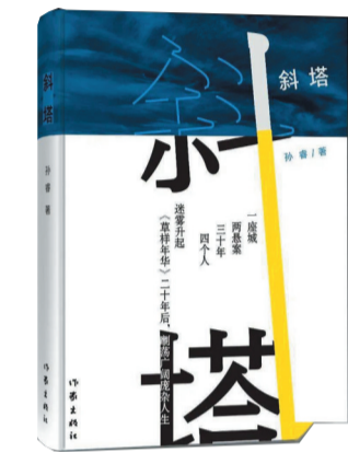
出版社:作家出版社 作者:孙睿 《斜塔》

该书钩沉黄海历史,讲述黄海故事,并全面表现黄海西岸人民在当今经略海洋、向海图强的辉煌成果。作者广泛搜集有关资料,并从长江口走到鸭绿江口进行实地考察,经过反复筛选、斟酌,才从海量材料中提炼出要表现的内容。《黄海传》视野开阔,气韵丰沛,结构精巧,文笔生动,是中国海洋文学创作的重要收获,也是大众读者认知黄海、了解海洋文化的高品质读本。