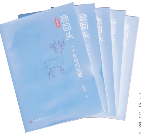
《鹿回头 一个永恒的主题》 作者:高照清 出版社:中国华侨出版社

高照清散文创作的表现视角,以自己的眼睛、耳朵和感觉来感知这里的岁月,这里的乡土,这里的人世间。“我是怀着一颗虔诚的心,揣着一份兴致勃勃的情,踏进青岭的。自涉足青岭的那一刻起,我就被绿色包围了:满山的青一丛丛,满岭的翠一簇簇,满野的绿一片片……”在高照清的笔下,绘就的正是四季花开的美景,触目所及的黎山黎水,以及由之而生发的黎情。读高照清的散文,不仅能够“把我们从焦虑中解放出来”,而且,让人们对于多元文化有了更多的了解与认知。