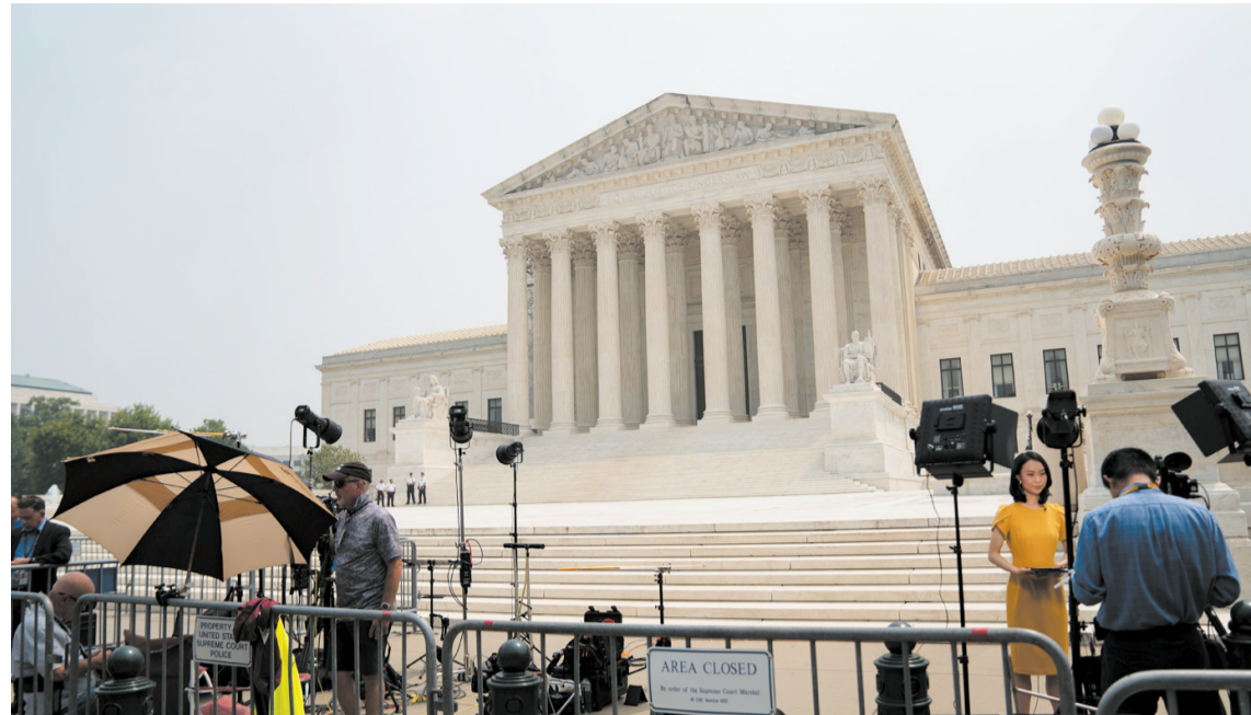
这是6月29日在美国首都华盛顿拍摄的美国联邦最高法院。

按照一些美国媒体的解读，这一裁决是当前保守派法官占多数的最高法院权力格局衍生的结果，凸显美国政治对立分化现状。共和党为此雀跃，总统约瑟夫·拜登为首的民主党人则抨击该裁决“违背美国基本价值观”。