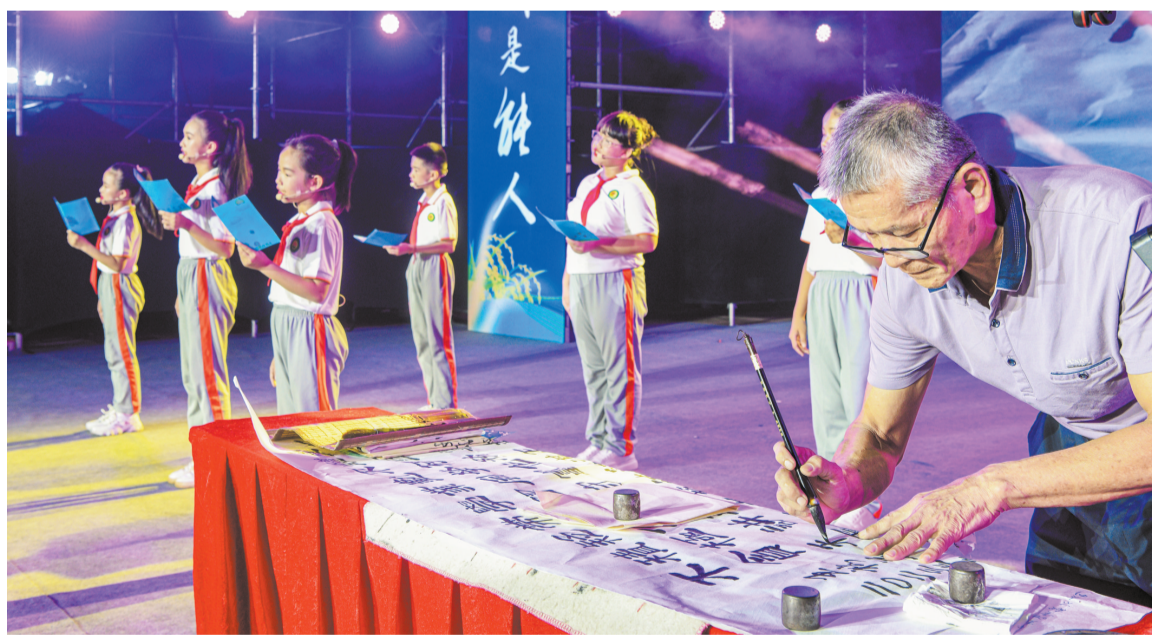
书法能人活动现场挥毫泼墨。