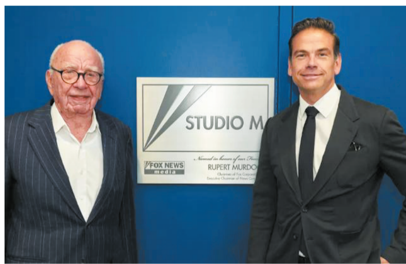
默多克与拉克伦 (资料图)

就权力交接后默多克家族企业走向何方,默多克传记作者迈克尔·沃尔夫推断,拉克伦已实际“掌舵”多年,且与父亲默多克的保守政治立场最接近,他短期内不太可能作出重大调整。