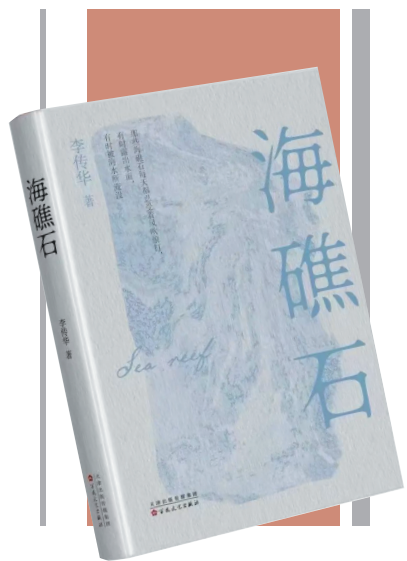
《海礁石》 作者:李传华 出版社:百花文艺出版社

李传华是一位热爱生活而又熟悉社会生活的作家,他粗略而有的笔触时时传递出这个时代特有的生活气息,《海礁石》这部长篇新作体现了他观察生活的不凡的洞察力和表现力,叙述有腔调,人物有个性,是一部写实力强的现实主义小说。