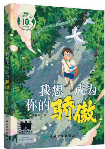
《我想成为你的骄傲》 作者:陈伟军 出版社:人民卫生出版社

“有人说青蛙坐在井里仰望天空是多么可笑的事情,但我懂得青蛙知道他的梦想是有一天变成王子,骑