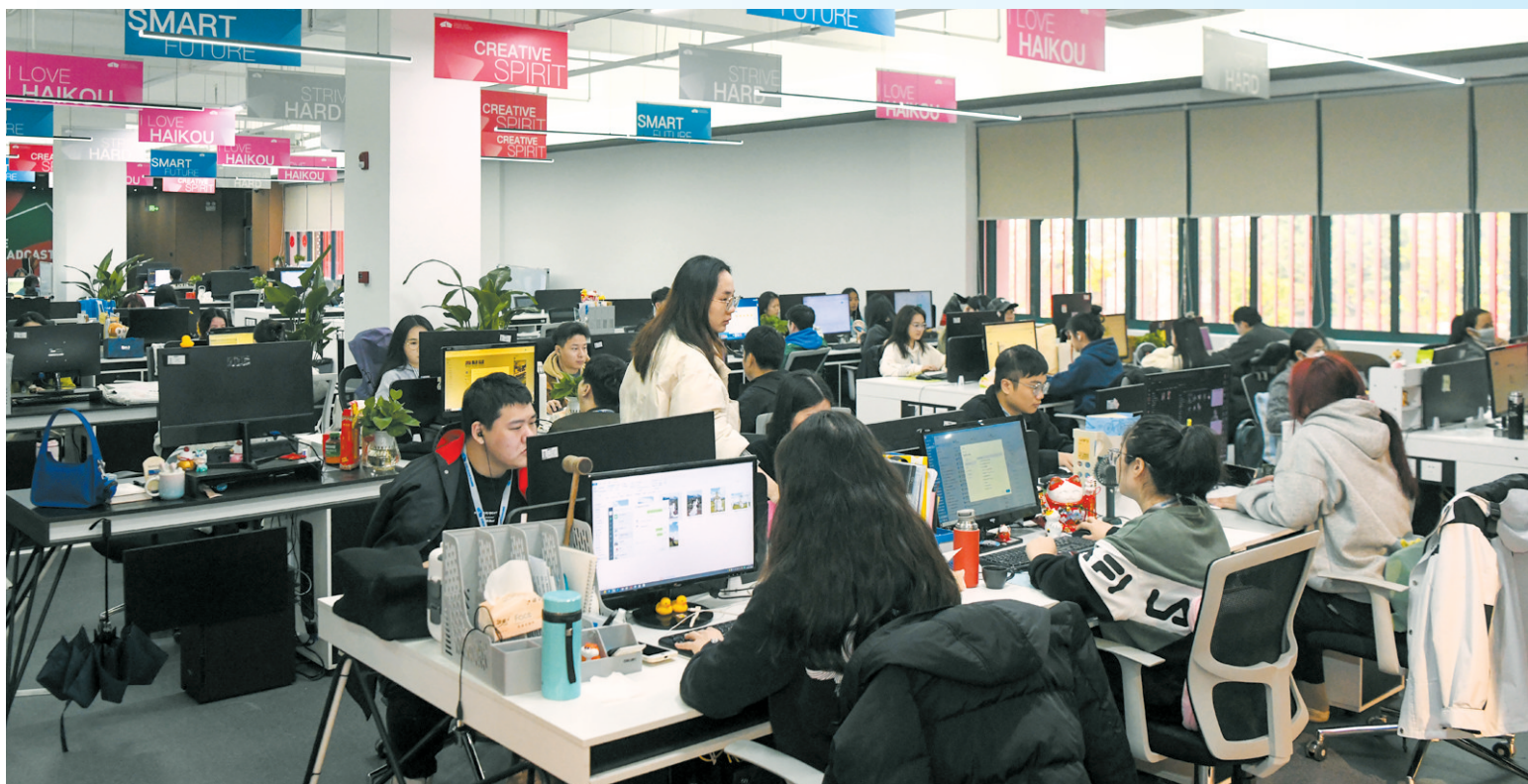
琼山区数智科创园开园运营,入驻企业工作人员已开始办公。

本报3月2日讯(记者赵汉 特约记者许晶亮)3月1日,琼山区数智科创园正式开园运营,系该区首个数字经济与楼宇经济双引擎驱动的产业园区。琼山区楼宇经济协会同步揭牌成立。