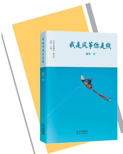
《我是风筝你是线》作者：巍然 出版社：北京出版社

随着时代的快速发展，农活儿、亲人、艺人与乡邻，都渐渐渐远。作者用平实的语言如数家珍地故乡的风土人情娓娓道来，似小桥流水，不急不缓，不做作，不煽情，有的只是化不开的乡情，抹不去的乡愁，割舍不断的旧时风月……时光不可倒流，生活仍要继续。让我们怀着思念之心珍惜现在，将每一天都过得充实，精彩，有意义。