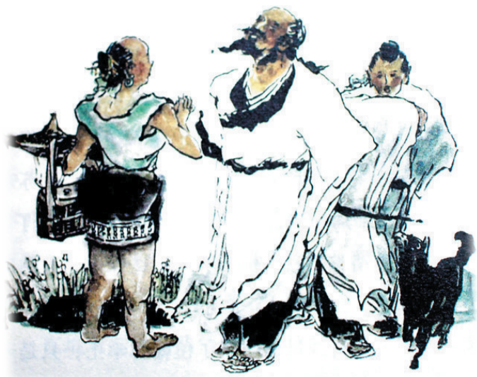
▲《偶遇春梦婆》刘运良 绘

东坡故事里，娓娓道来尽是东坡先生贫困平凡，却是有声有色有趣的谪居生活。他的笔墨之间流淌出来的尽是坡翁特有的浓浓人情味。这本书让我读懂了东坡处变不惊的从容淡定；读懂了东坡身处绝境仍乐观向上的人格魅力；也读懂了东坡先生千古流芳的道德文章。