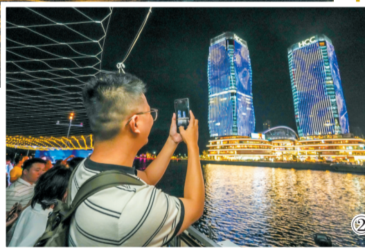
①5月24日,“海南之星”号游船行驶至海口湾。 ②游客在“海南之星”号游船的船舱外欣赏海口夜晚的美景。