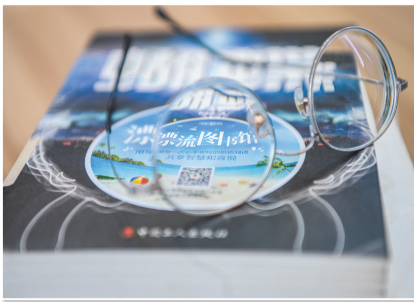
▲在全民阅读·红华书屋内,贴有漂流图书馆标签的图书。

它们散发着浓厚的文化气息,吸引着无数居民和游客前来探寻与品味。“相对于丢书而言,我们更怕没人读书,没人借书。”这句话道出了省图书馆工作者们的心声。他们害怕的不是书籍的流失,而是人们对阅读的淡漠和遗忘。在他们看来,书籍是传承文化、启迪智慧的重要载体,而阅读则是人们获取知识、丰富内心世界的重要途径。