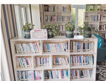
▲第五个全民阅读点屯昌梦幻香山站。