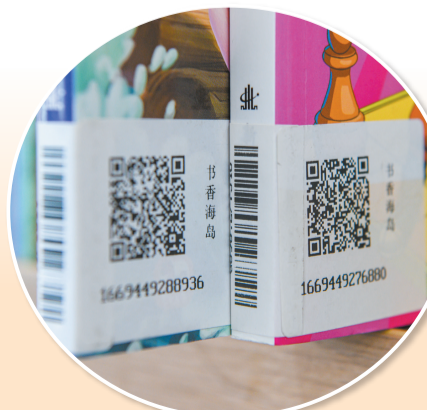
▲在红华书屋,读者扫描图书上的二维码就可以线上阅读。