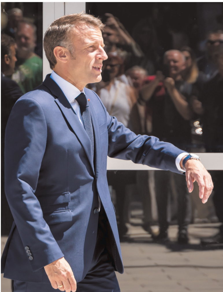
6月9日，在法国勒图凯市，法国总统马克龙在参加欧洲议会选举投票后走出投票站。

同样失意的是比利时首相亚历山大·德克罗。他9日晚含泪宣布辞职，成为看守首相。他领导的荷语开放自民党在比利时9日举行的联邦、地区和欧洲议会“三合一”选举中失利，七党执政联盟将失去在议会中多数地位，让德克罗不得不接受“选民发出的信号”。沈敏（新华社专特稿）