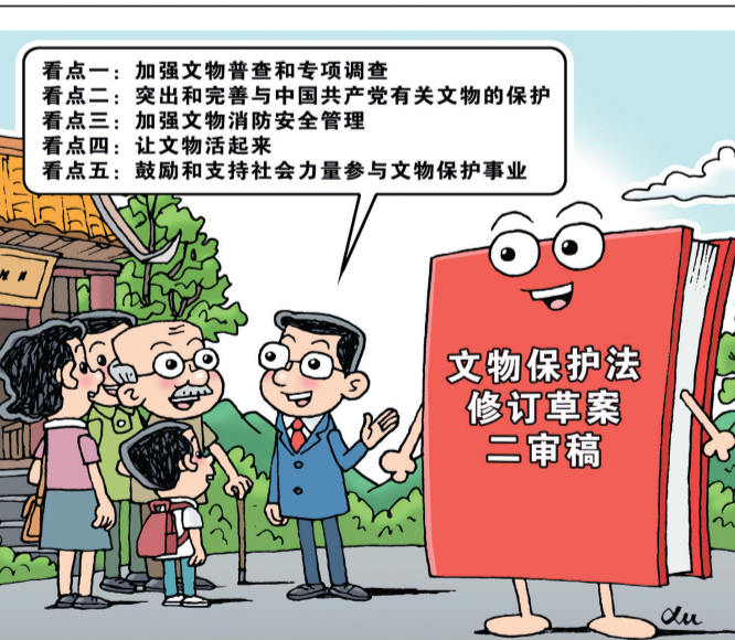
五大看点 新华社发 徐骏 作

去年10月草案一审稿提请审议后,公开征求社会公众意见。草案二审稿吸纳各方面意见建议,明确了加强文物普查、加强文物消防安全管理等内容。