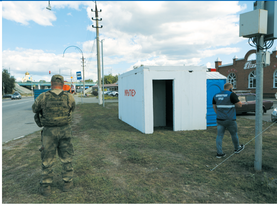
8月12日,在俄乌边境俄方一侧别尔哥罗德州首府别尔哥罗德市,军人在临时掩体旁执勤。

乌克兰空军当天在社交媒体发文说,18日晚至19日凌晨,俄军从库尔斯克州、奥廖尔州和克里米亚等地向乌境内发射了87架攻击型无人机。